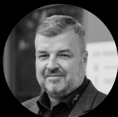
Radek Nachtmann P.V.A. systems